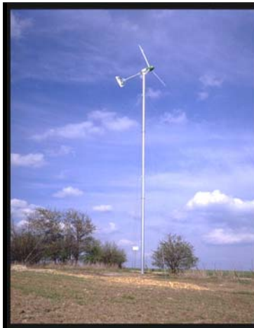
Aerogenerador de 10 kW

Todos los aerogeneradores son tripalas y sin regulador.