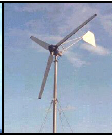
Aerogenerador de 5 kW