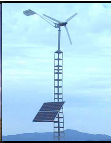
Aerogenerador de 1.4 kW